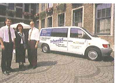
Infomobil: Bürgerberatung vor Ort

Bisher wurden Abwassergebühren nach dem Frischwasserverbrauch abgerechnet. Vor dem Hintergrund der aktuellen Rechtsprechung ist der so genannte Einheitsgebührenmaßstab für die meisten Städte nicht mehr zulässig. Die Gebührenberechnung muss stattdessen verursacherorientiert erfolgen. Das heißt: In den Kanal geleitetes Schmutzwasser wird weiterhin auf der Grundlage des Frischwasserverbrauchs berechnet, Regenwasser jedoch nach der Flächengröße, von der es abgeleitet wird.